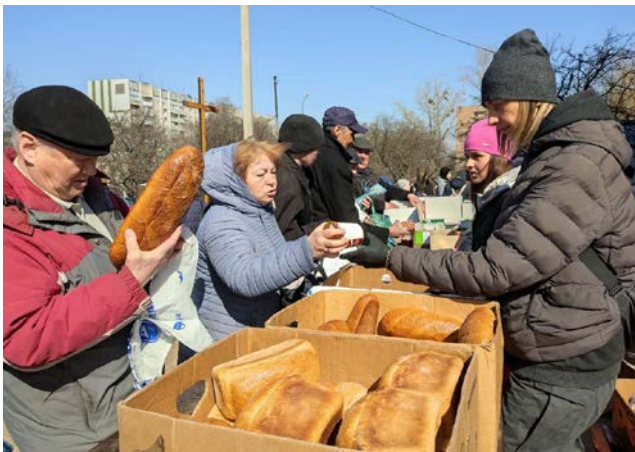
Die Salesianer Don Boscos helfen mit der Verteilung von Lebensmitteln.

Neben der Bildung leisten die Salesianer humanitäre Hilfe, darunter die Versorgung von mehr als 1.000 Flüchtlingen in Lviv mit Nahrung, warmer Kleidung und Medikamenten. Sie sind auch in anderen Teilen des