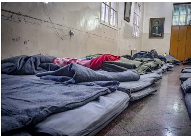
Nach dem Erdbeben: Don Bosco Aleppo bot 850 Menschen eine Unterkunft.