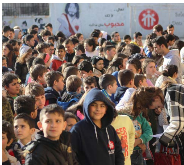
Wöchentlich werden rund 800 Kinder in der Don Bosco Einrichtung in Aleppo betreut.

Gegenwärtig unterstützen wir ein Solarprojekt sowie Hilfsprojekte für vulnerable Familien und fördern psychosoziale Projekte zur Bewältigung von Traumata bei Kindern und Jugendlichen. ◀